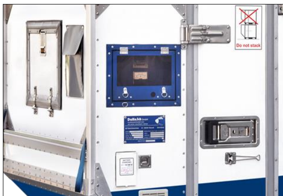
Einfach zu bedienende Steuerung.