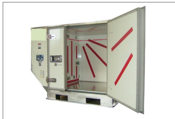
Der Frachtraum mit einer Ladehöhe von 1.170 mm (46 in) bietet Platz für 1 Euro Palette oder 1 US Palette.